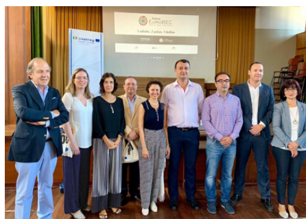
"Juegos Rayanos" (Eurociudad Elvas-Badajoz-Campomayor, proyecto EUROBEC )