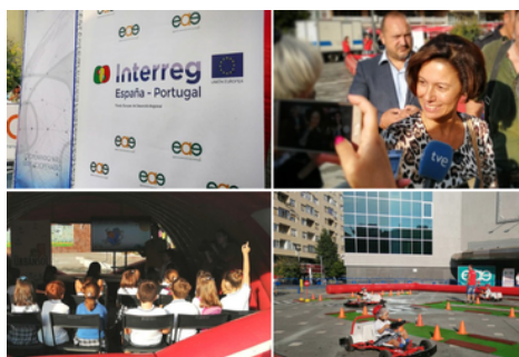
Taller medioambiental y Karts eléctricos por la movilidad sostenible (Proyecto RED URBANSOL )