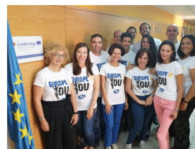
SC POCTEP EC Day 2019