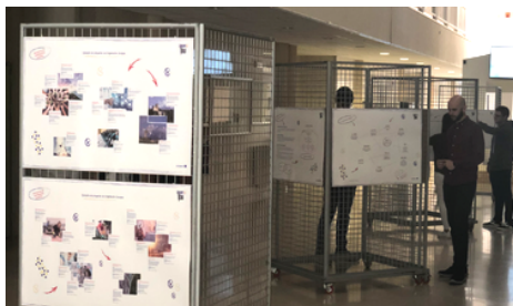
Exposición Interactiva en la Universidad de Extremadura en Cáceres (proyectos 4ie / 4ie plus )