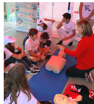
Taller de adaptación al cambio climático, Cruz Roja EspañaPortugal (proyecto CVPCRE / UNITE)