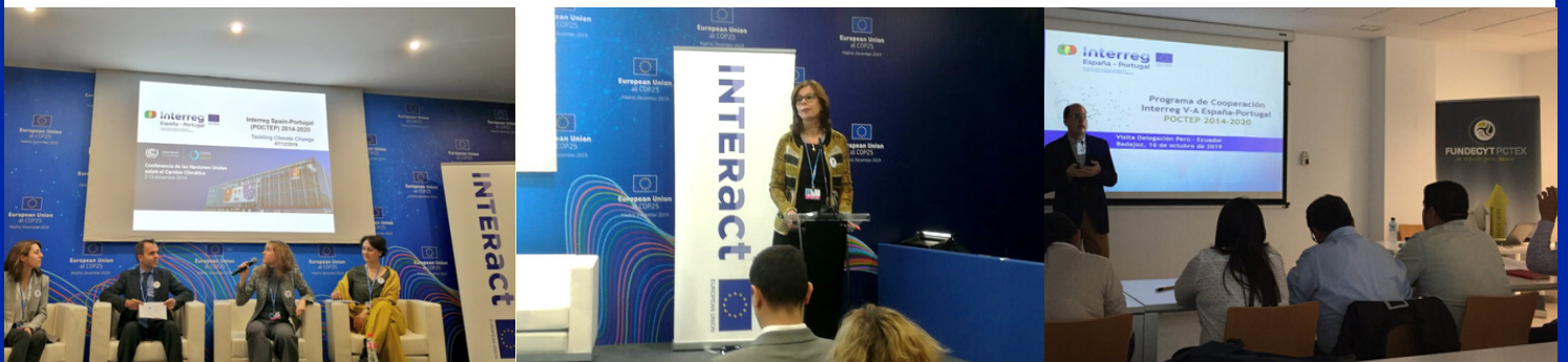
Izquierda y centro: la Autoridad de Gestión presenta el Programa en la Cumbre del Clima de la ONU COP 25 (07/12/2019); derecha: presentación POCTEP ante la delegación Perú-Ecuador (Badajoz, 16/10/2019).

También se compartieron experiencias en eventos como la presentación de resultados de cooperación transfronteriza Galicia-Norte de Portugal , el EUROACE Ecodesign Meeting o la Feria Hispanolusa FEHISPOR , donde el POCTEP tuvo stand propio (foto de la derecha).