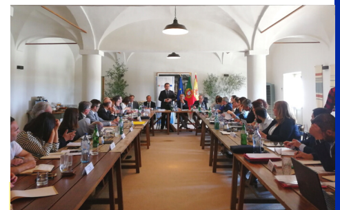
Comité de Seguimiento en Reguengos de Monsaraz, 6-7/6/19.

En la tercera convocatoria (proyectos estratégicos o estructurantes), resuelta el 30/10/2018, se aprobaron 3 proyectos de 5 candidaturas presentadas (inversión aproximada 73 M€, 55 M€ FEDER ).