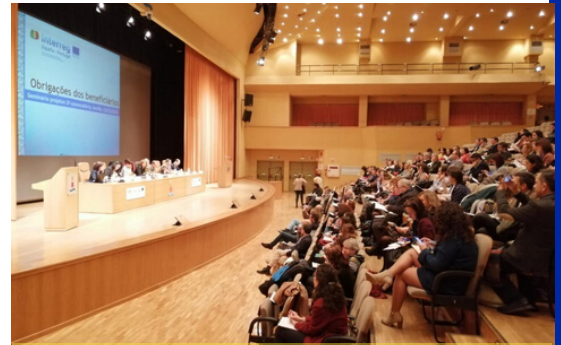
Arriba: Seminario para beneficiarios segunda convocatoria en Sevilla (12 de diciembre). Abajo, Encuentro de proyectos de Turismo en Badajoz (23/11/19).

También se participó en la red Interact de Cambio Climático, lo que culminó con la inclusión de dos proyectos POCTEP en el ebook temático Interreg tackling climate change y con la presentación del Programa en la Cumbre del Clima COP25 de Naciones Unidas en Madrid (diciembre 2019).